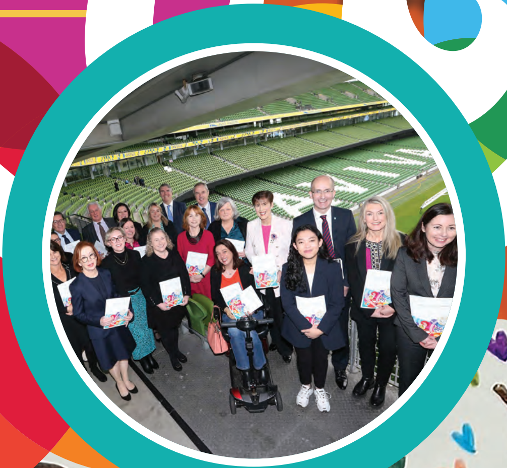
Comhaltaí an Choiste Stiúrtha